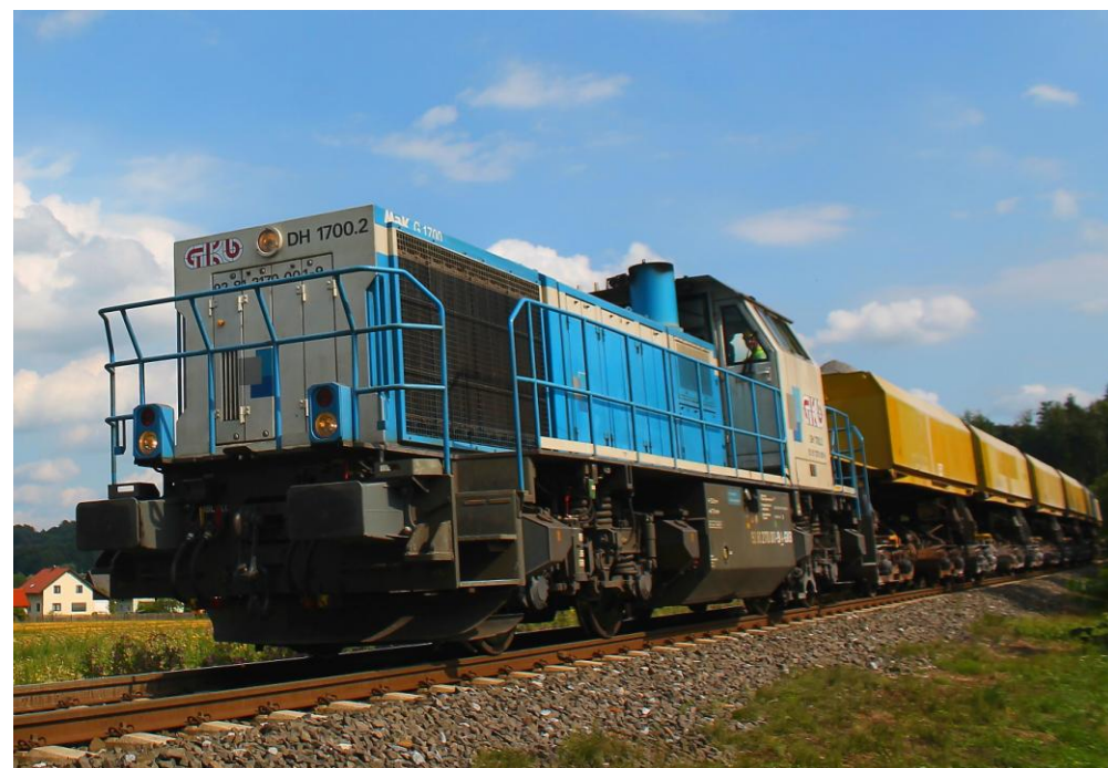
GKB Diesellokomotive DH 1700.2, noch im LTE Farbschema mit GKB Beschriftung