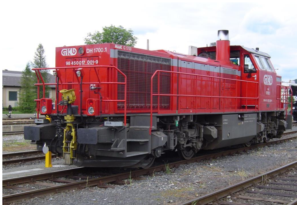
GKB Diesellokomotive DH 1700.1

2013 wurde die LTE 2170.001 von der GKB übernommen und wird nun als GKB 1700.2 bezeichnet. Sie kommt hauptsächlich beim Transport von Baustoffen für die Koralmbahn zum Einsatz.