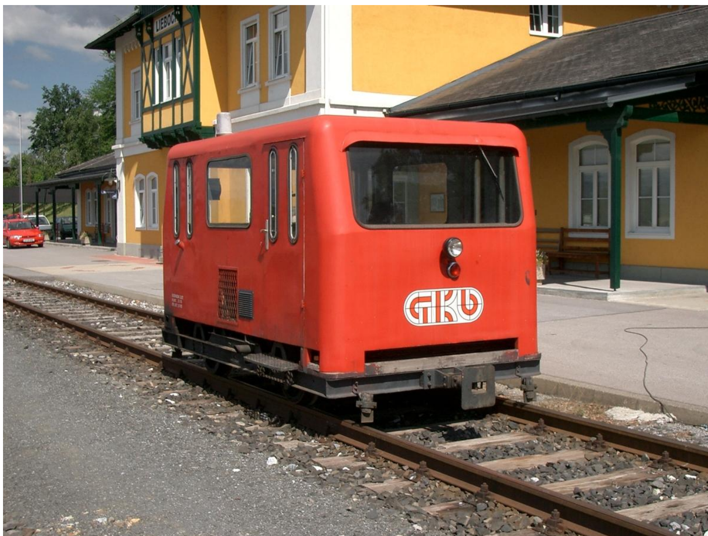
Die „Kreszenzia“ am 3. September 2003 vor dem Bahnhof Lieboch

Heute wird sie noch kaum verwendet, aber vom Verein „Steirische Eisenbahnfreunde“ weiterhin gepflegt und betriebsfähig erhalten. So wurde die „Kreszenzia“ bei zahlreichen Bahnhoffesten für Publikumsfahrten eingesetzt.