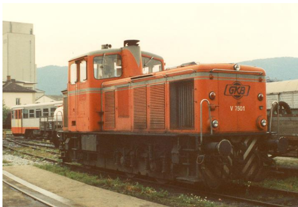
GKB Diesellokomotive DE 750.1, im Jahr 1993 bereits ausgemustert am Graz-Köflacher Bahnhof

Im Jahre 1993 wurden alle Maschinen bei der GKB ausgemustert und schließlich 1995 verschrottet. Bei der Steirischen Landesbahn sind noch immer zwei Maschinen als DE1 und DE2 im Dienst.