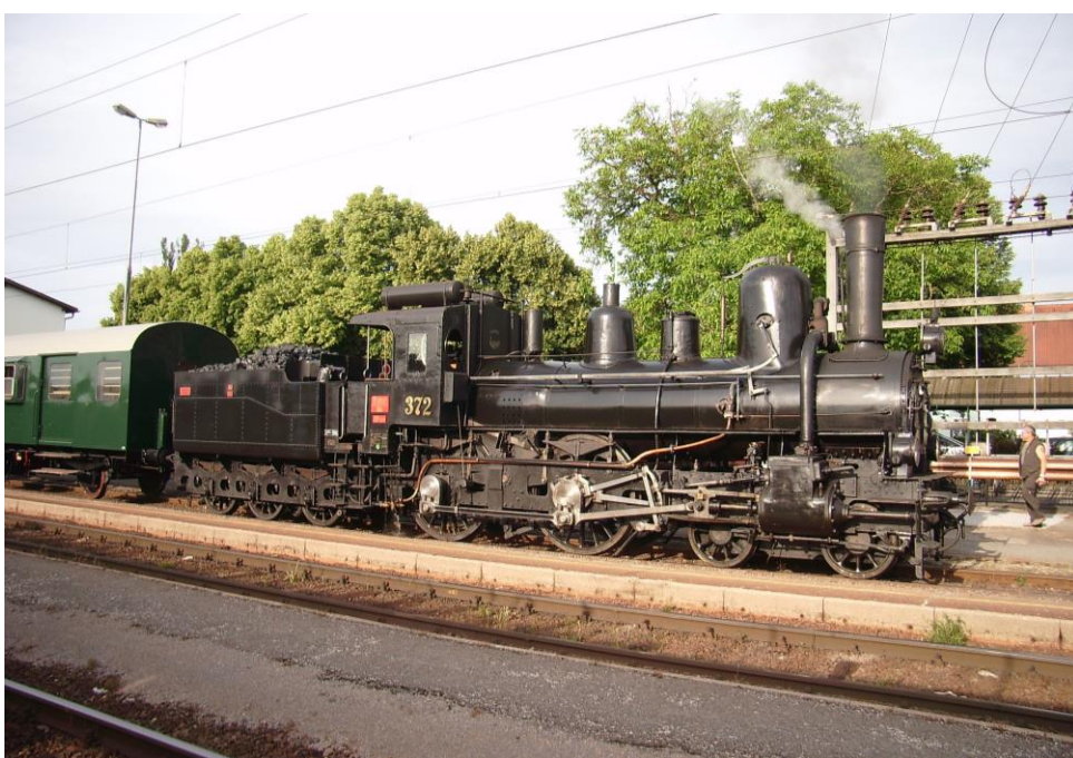
Die ehemalige GKB Maschine „372“ wird heute vom Eisenbahnmuseum Strasshof erhalten, hier anlässlich der GKB/StEF Sonderfahrt „100 Jahre Südbahn“ am 27. Mai 2007 am Bahnhof Leibnitz

Die „372“ wurde 1968 von der GKB an das Österreichische Eisenbahnmuseum abgegeben. 1973 wurde sie ins Eisenbahnmuseum Strasshof überstellt und vom Verein 1.öSEK betriebsfähig aufgearbeitet. und optisch in den Ursprungszustand versetzt.